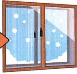
既存単板サッシ + 内窓 (Low-e 複層ガラス)