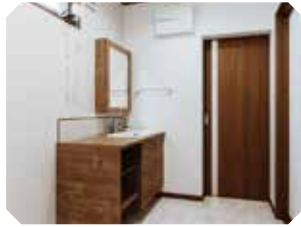
洗面化粧台 「ドレーナ木目調キャビネットタイプ」