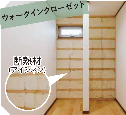
断熱材 (アイシネン)