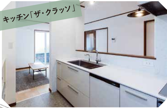
キッチン「ザ・クラッソ」