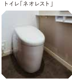
トイレ「ネオレスト」