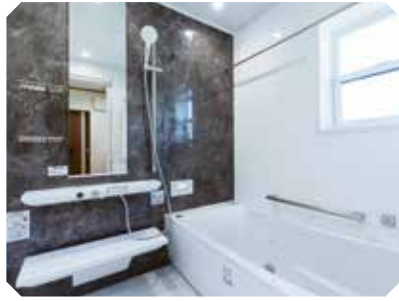
お風呂「シンラ HKシリーズDタイプ」