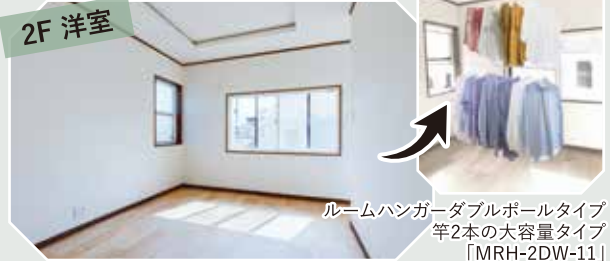
ルームハンガーダブルポールタイプ 竿2本の大容量タイプ 「MRH-2DW-11」